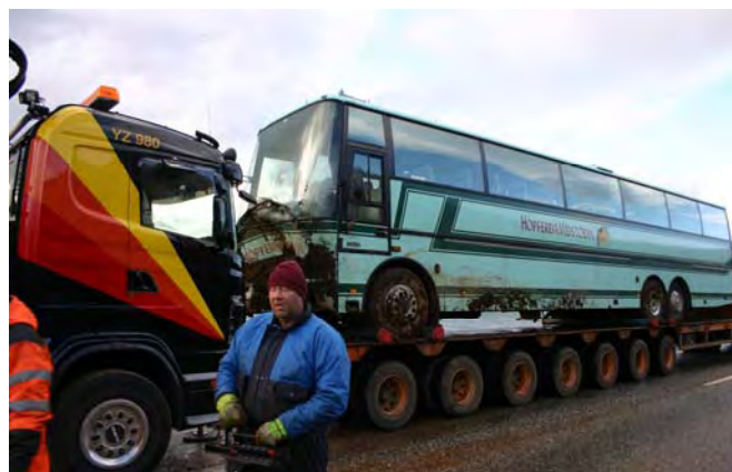
Hóperðabíllinn kominn á flutningavagn í Kollafirði

Farþegum var boðið uppá sálræna skyndihjálp á vegum Rauða kross Íslands en sú aðstoð var afþökkuð þar sem hópurinn var á leið í flug til útlanda.