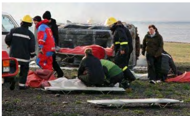
Heimamenn á slysavettvangi

Æfingin gekk mjög vel og reyndi þar á björgunarmenn frá slökkviliði, björgunarsveit og almenna íbúa Grímseyjar. Allir aðilar gengu vasklega til verks við að slökkva elda, bjarga fólki úr flaki flugvélar og sinna slösuðum.