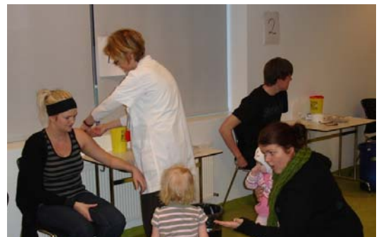
Frá bólusetningu á Suðurnesjum 17. desember s.l.

Fyrsti markópur til bólusetningar voru heilbrigðisstarfsmenn og hófst bólusetning þessa hóps í viku 42 eða 15. október. Þann 17. október voru næstu aðilar kallaðir inn á Landspítala til bólusetningar. Í þessum hópi voru lögreglumenn, slökkviliðsmenn, áhafnir Landhelgisgæslu, neyðarverðir 112, tollverðir, fangaverðir og hluti af félögum í björgunarsveitum á höfuðborgarsvæðinu. Í vikunni þar á eftir var lokið við að bólusetja öryggishópa um allt land og bólusetning sjúklinga með undirliggjandi sjúkdóma gat hafist. Samhliða því verkefni var unnið við að kortleggja umfang nauðsynlegrar starfsemi og að því búnu var lykilstarfsmönnum nauðsynlegra stofnana og fyrirtækja boðið til bólusetningar. Sömu fyrirtæki og stofnanir voru jafnframt hvött til þess að virkja áætlanir vegna órófins reksturs. Dagana 17. 18. og 19. nóvember hófst bólusetning þessa hóps innan höfuðborgarsvæðisins á heilsugæslustöðinni í Árbæ og áfram var haldið 25. og 26. nóvember á Landspítalanum í Fossvogi. Í sömu vikum var forgangshópum á landsbyggðinni boðið til bólusetningar. Almenn bólusetning hófst þann 23. nóvember en aðeins var hægt að bólusetja í nokkra daga vegna hnökra á afhendingu bóluefnis erlendis frá. Endurskipuleggja þurfi áætlanir og það var ekki fyrr en 15. desember sem hægt var að hefja bólusetningar almennings á nýjan leik.