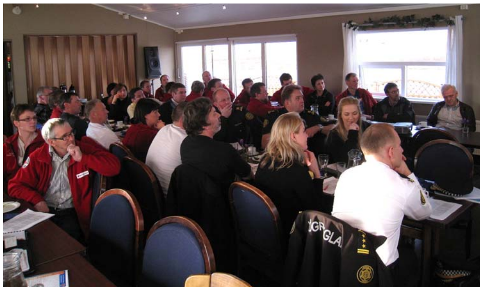
Mynd frá fundi AVD á Helli með almannavarnanefnd Rangárvallasýslu og Vestur-Skaftafellssýslu.

Nú á haustmánuðum hafa starfsmenn almannavarnadeildarinnar heimsótt almannavarnanefndir, sveitarstjórnarmenn og viðbragðsaðila um landið og fundað með þeim. Á þessum fundum hefur verið farið yfir skipulag og verkefni almannavarna í ljósi nýrra laga nr. 82/2008. Samkvæmt lögunum er það hlutverk ríkislögreglustjóra að samhæfa störf viðbragðsaðila og starfa með öllum þeim sem koma að almannavörnum, þar með talið almannavarnanefndum, sem samkvæmt 10. og 16. grein laganna eiga að gera hættumat og viðbragðsáætlanir í sínum umdæmum. Almannavarnadeildin hefur verið að vinna að verkefni um áhættuskoðun í samstarfi við lögregluumdæmin þar sem metin er áhætta út frá náttúruvá, umhverfi og heilsu, helstu innviðum og samfélagsöryggi.