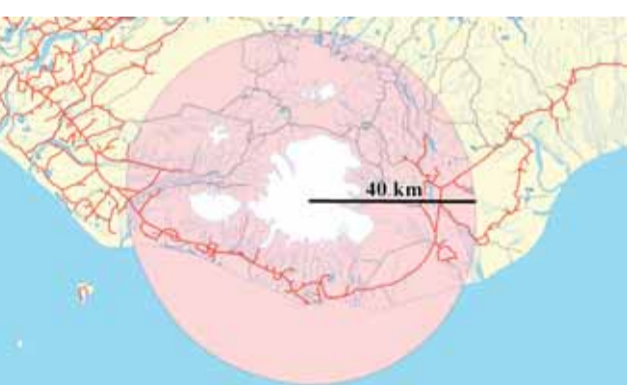
Områder med fare for lynnedslag i vulkanrøgsojlen pga. vulkanudbrud i Katla.

Der er store mængder elektricitet i vulkanrøgsojlen og fare for lynnedslag i en radius på 30-40 km fra Katla. Hold Dem øverst på fjeldsiderne eller oppe på bakker. Undgå de højeste områder. Hvis der søges skjul i en bil, skal døre og vinduer være lukkede. Brug ikke radiokommunikation eller andet telekommunikationsudstyr. Undgå metaldele, der kan lede elektricitet.