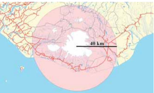
Svæði þar sem hætta er á eldingum í gosmekki sökum eldsubrota í Kötlu.