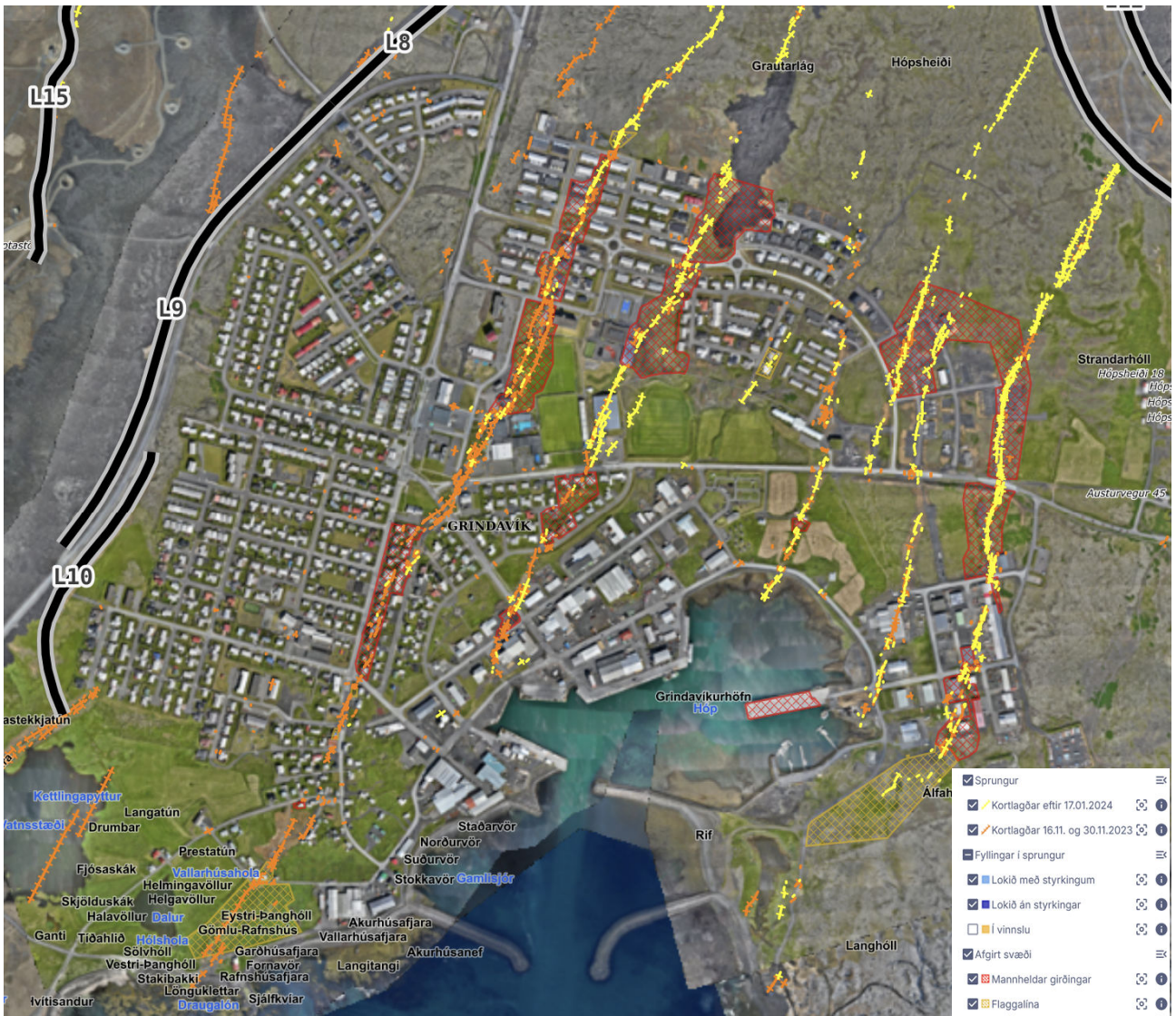
Mynd 1. Staða sprungna og viðgerða 29. maí 2026 samkvæmt Sprungusjá (kort.eflamap.is/sprungusja).

Virkt eftirlit þarf að vera áfram með sjónskoðun á svæðinu og vöktun mælingarpunkta sem eru víðsvegar í bænum. Vöktun er nauðsynleg til að fylgjast með áframhaldandi landsbreytingum og breytingum á spurnum í Grindavík.